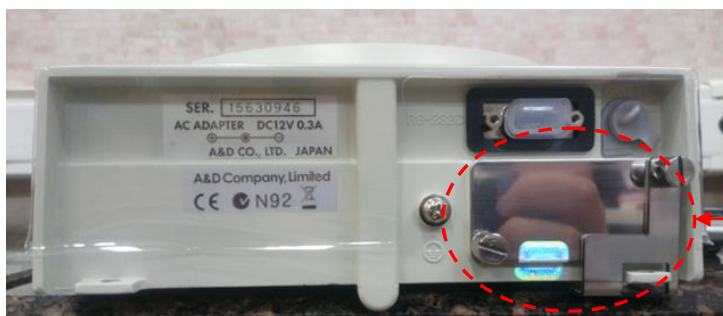
Схема пломбировки от несанкционированного доступа представлена на рисунке 2.

Место пломбировки с помощью разрушаемой наклейки и/или проволочной пломбы